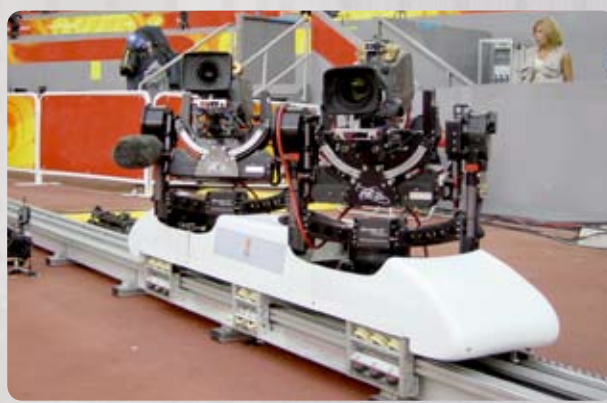
Speedtrack droit et courbe avec GYRON/Stab C Compact