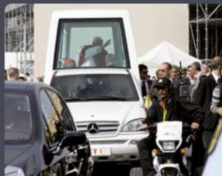
Tricycle Loustic pour travelling sur la Papamobile