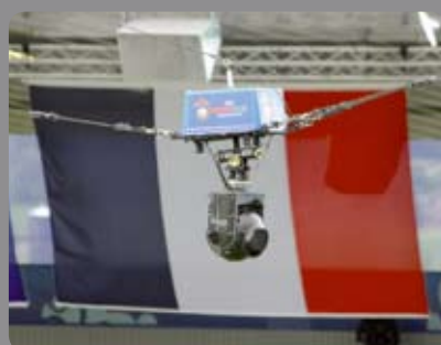
Cablecam 2D EURO 2008