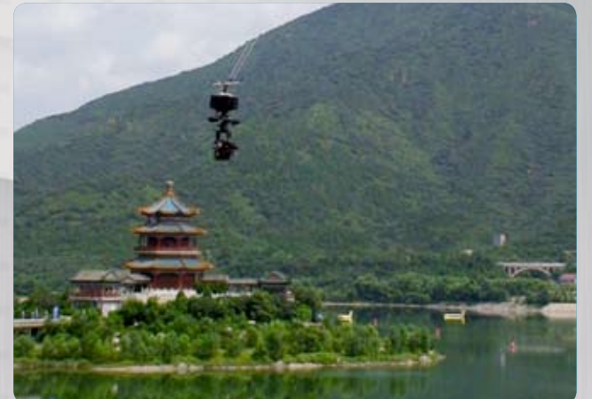
Cablecam 2D Triathlon