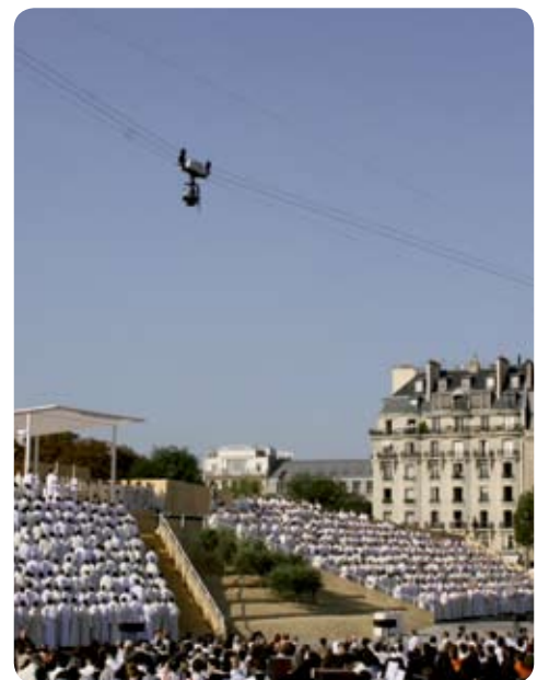
Cablecam 1D, visite du Pape Benoît XVI aux Invalides