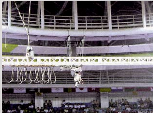
Rail Filou suspendu avec Peepod