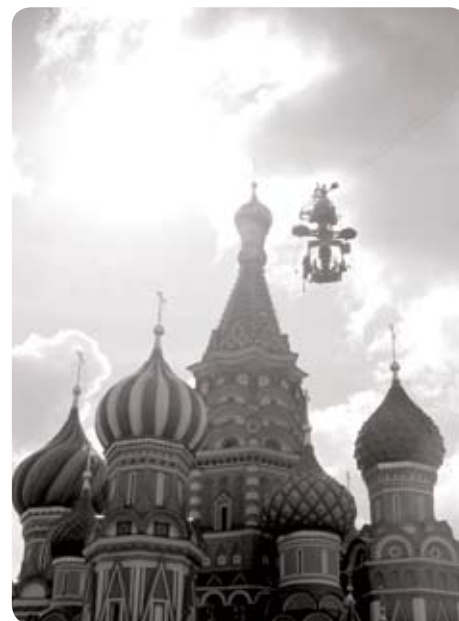
Cablecam 2D, la Place Rouge au Kremlin

• Pour le championnat Top 14 de Rugby, le stade France a sollicité ACS France qui a, sur cette opération, travaillé en collaboration avec le groupe d'intervention du Raid. Les hommes du Raid sont descendus en rappel d'un hélicoptère au dessus de la pelouse et ont amené le ballon du match au centre du terrain de jeu.