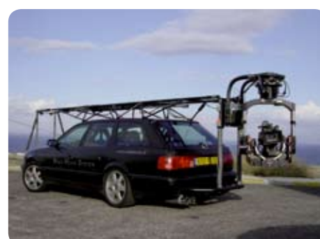
Audi avec GYRON/Stab C pour pub Infinity