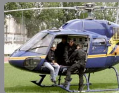
Le Raid au Stade de France Rugby Top 14