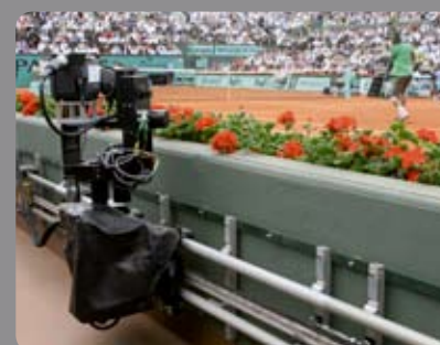
Rail Filou ROLAND GARROS 2008