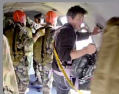
Caméra embarquée Les Femmes de l'Ombre