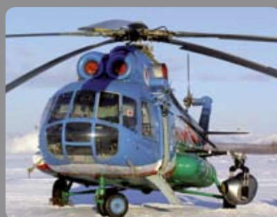
GYRON/Stab C side sur M18 MC4 Loups