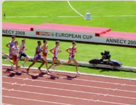
Speedtrack avec GYRON/Mini C HD