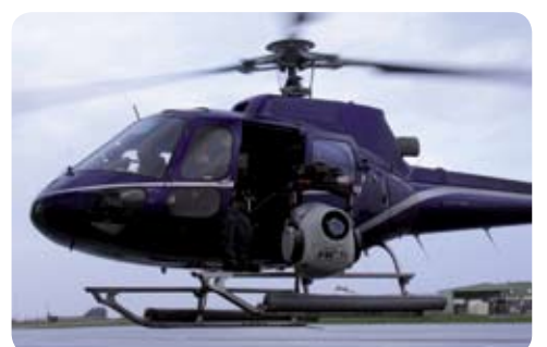
Super GYRON pour Océans