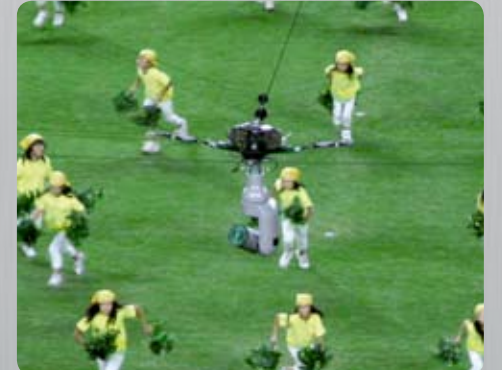
Cérémonie d'ouverture avec le Cablecam 3D