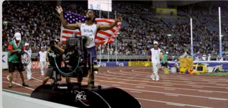
Arrivée du vainqueur avec le Speedtrack 100m