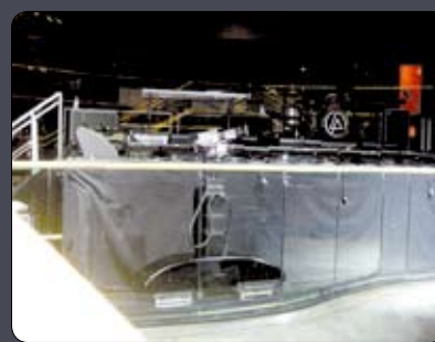
La SUPERTOWER position basse