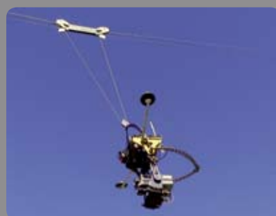
Cablecam 2D IMAX F26