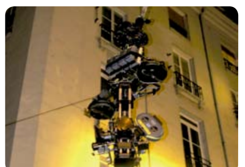
Cablecam 2D pour Go Fast