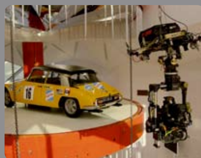
Mini C Cablecam Citroën C42