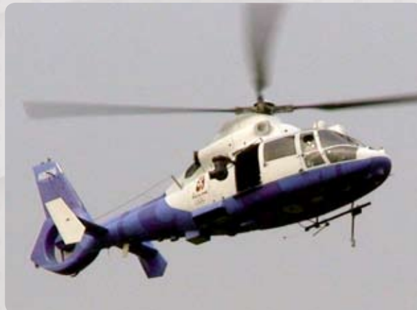
Bracket Side pour les hélicos