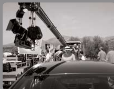
GYRON/Stab C Bienvenue chez les Ch'tis