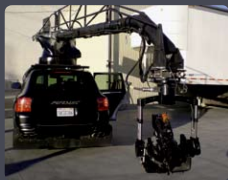
GYRON/Stab C Compact