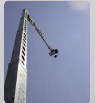
Grue géante 53m GYRON/Stab C