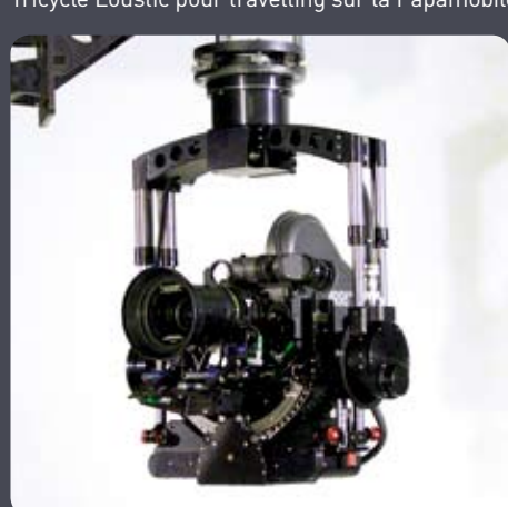
Gyron FS/Stab C Compact Film & video