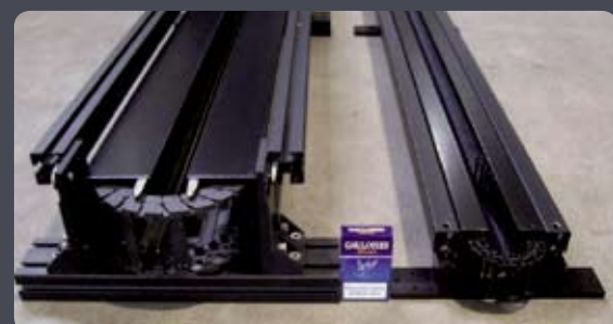
Comparatif avec Speedtrack et mini Speedtrack

Le tricycle Loustic peut être équipé d'une tête gyro-stabilisée ou d'un Steadicam. Un silence absolu est obtenu grâce à son moteur électrique et une vitesse de pointe de 35km/h.