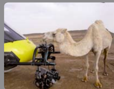
GYRON IMAX The Greatest Journey