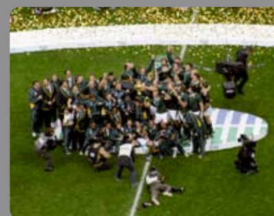
Cablecam 3D Coupe du monde de Rugby 2007