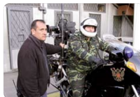
GYRON/Mini C sur moto travelling