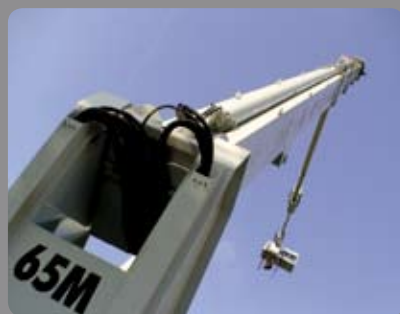
Grue géante 65 m Bancs publics