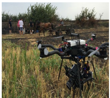
> Drone Alta 6

Air-ground pursuits on a circuit in the Parisian Region for Renault Zoé car commercial, shot with the Alta 8 (-25Kg) fitting a Red Dragon 6k and Angénieux 15-40.