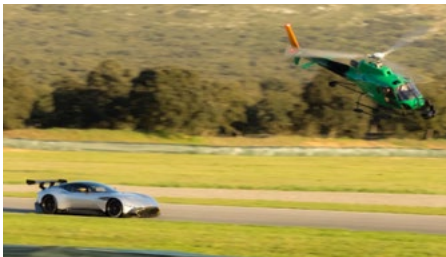
> Shotover K1 - Alexa Mini et un Angénieux 24-290 mm.

Our expertise guarantees you a perfect aerial coordination on your shoot ! Overseeing historical aircraft, warplanes, or formation flights is part of our latest projects: La Promesse de l'Aube from Eric Barbier, Dunkirk from Christopher Nolan / Transformer V from Michael Bay.