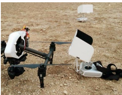
> Drone X5r

We are getting more and more involved in drone shoots in Europe, thanks to our being able to offer multiple configurations, -4Kg, -8Kg, -14Kg, or -25Kg; Full HD, 4k, 6k, 8K / 360°, clients are also coming back to us thanks to the high reliability of our teams.