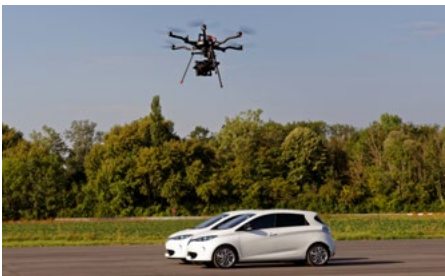
> Drone Alta 8

We did the drone aerials for the TV Series L'art du Crime , directed by Charlotte Brändström, for Gaumont TV. We were shooting in an urban area around the Amboise Castle with the DJI X5r featuring a 4K built-in camera; -4Kg and raw footage!