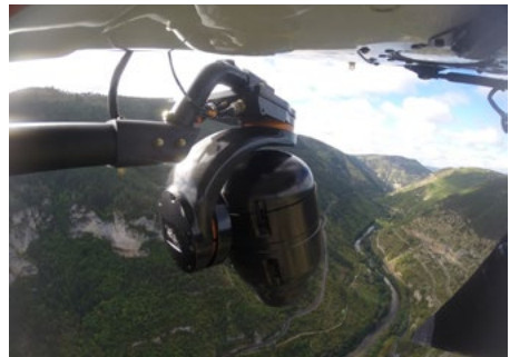
> Shotover F1/single pole RED dragon et Fujifilm 30/300